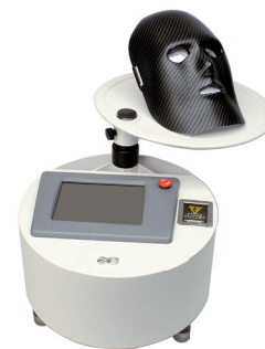
Tulip MED D®